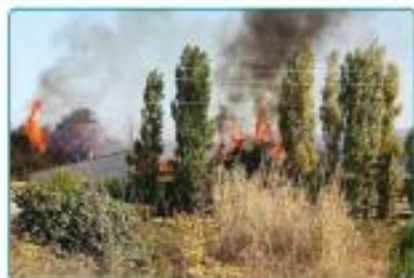
12/10 : Incendie spectaculaire sur la Commune.