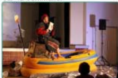
19/10 : " L'arche de Noémie ", un spectacle jeunesse qui a remporté un franc succès auprès des jeunes...et des moins jeunes.