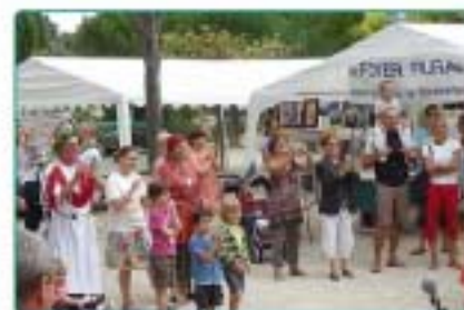
10/09 : Forum des associations Tourbaines, encore une belle réussite !