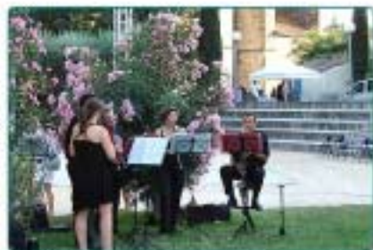
09/07 : Les "Estivales en Pays de Thongue", concert de jazz en plein air dans le magnifique cadre du parc de l'Abbé Anglade.