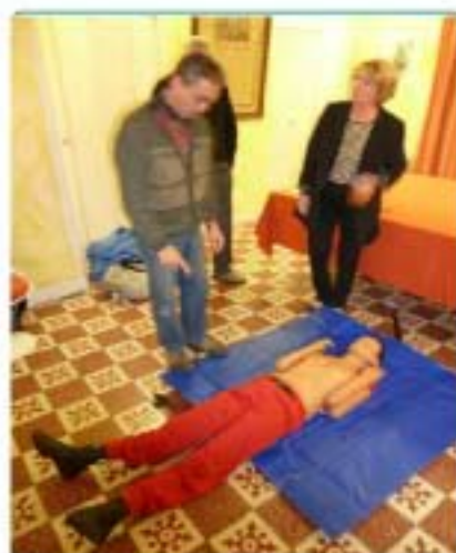
09/12 : Démonstration de 1 er secours avec la mise en place d'un défibrillateur.