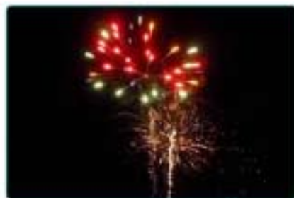
13/07 : Feu d'artifice et soirée conviviale animée d'un repas et suivie d'un bal.