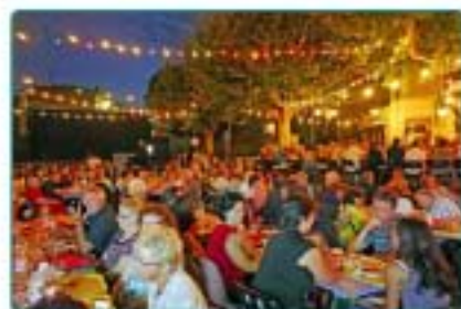
29/07 : Fête locale 2011, beaucoup de monde et toujours une bonne ambiance !