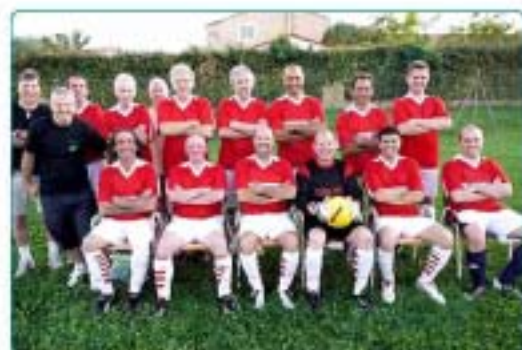
08/09 : Réception de nos amis Ecossais, au programme : foot, bonne ambiance et bonne humeur !