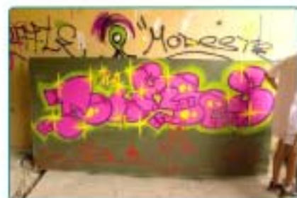
01/08 : Stage de Graff pour de jeunes artistes en herbe.