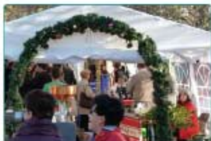
04/12 : 8 ème édition du Marché de Noël de Tourbes.