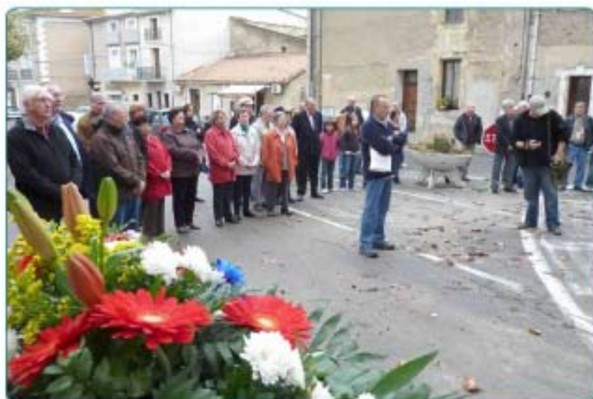
11/11 : Cérémonie de commémoration du 11 novembre