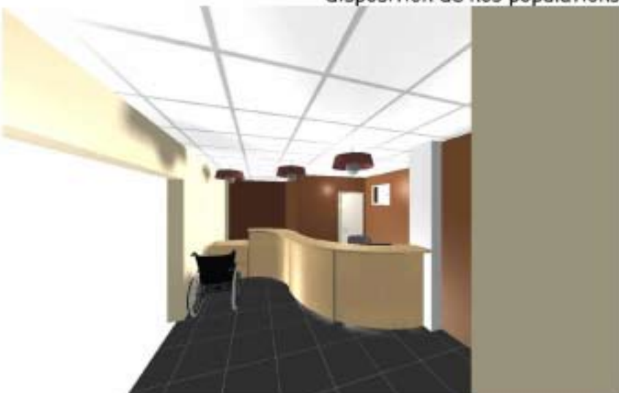
Aménagement intérieur de la future Agence Postale Communale

C'est une des raisons parmi bien d'autres qui nous permettront bientôt d'investir ce nouvel espace de vie mis à la disposition de nos populations.