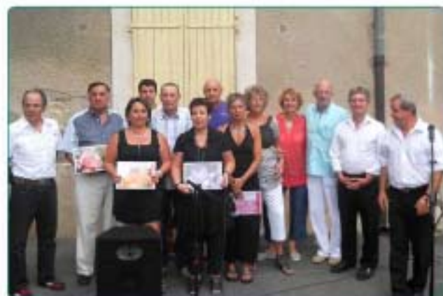
16/07 : Remise des prix du concours maisons et jardins fleuris : voici les lauréats 2011 !