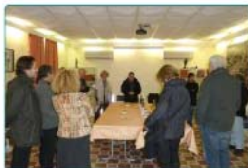
19/12 : Pot de remerciements pour les bénévoles du Marché de Noël