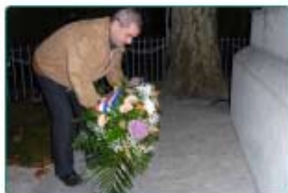
05/12 : Hommage aux Harkis