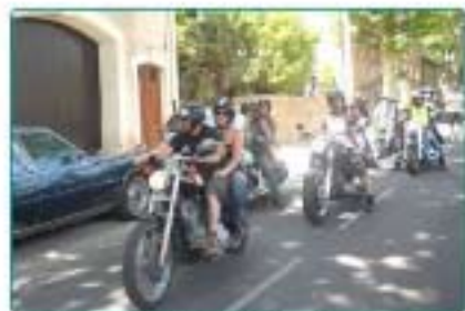
03/07 : Défilé de motos "Harley" et autres types, de beaux "engins" !